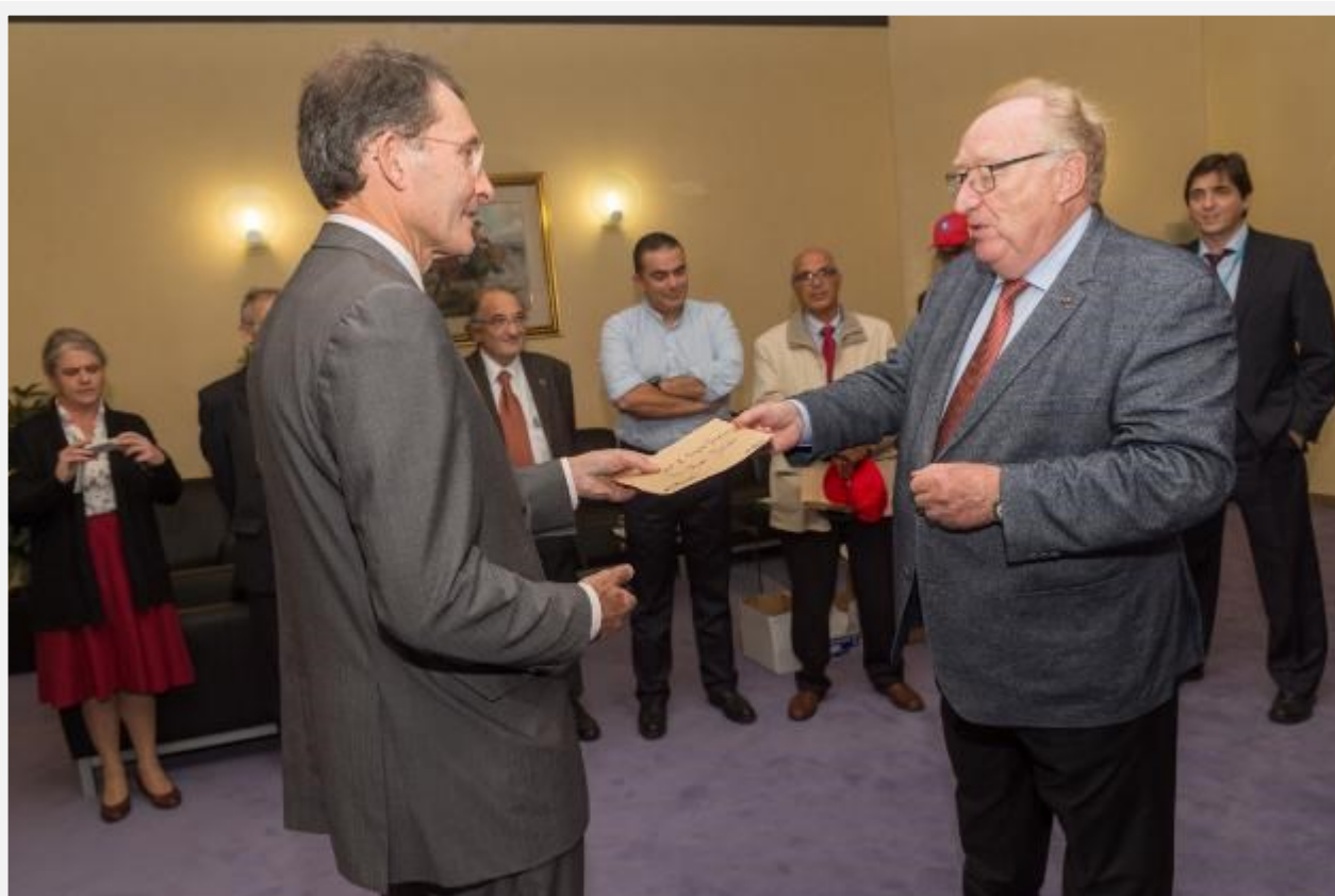
Remise de la pétition au Secrétaire général de la Commission

Au Conseil , c'est le responsable du protocole qui a réceptionné les signatures.